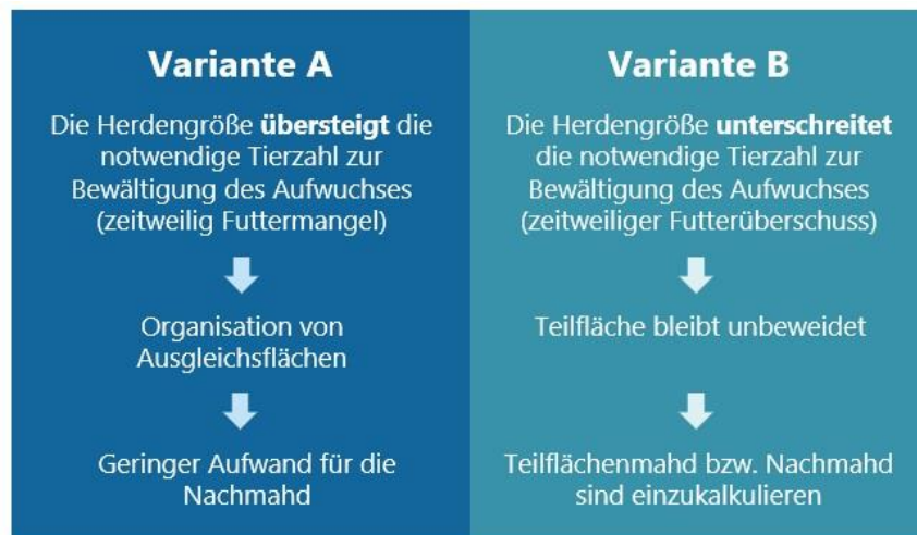
Abbildung 3: Beweidungsmanagement in Abhängigkeit der Herdengröße (Lfl 2019, S. 22). Für eine fachgerechte Beweidung der Anlagenflächen sollten Beweidungskonzepte erstellt werden.

Eine kurze, intensive Beweidung, die zur Etablierung artenreicher Grünländer empfohlen wird, hat ähnlich negative Auswirkungen auf die Fauna wie die Mahd (Zahn und Tautenhahn 2016; vgl. Kap. 3.2.1). Beispielsweise kann die Individuendichte von Heuschrecken stark abnehmen (Radlmair und Dolek 2002). Eine zeitlich gestaffelte Beweidung von Teilflächen bietet den Tieren räumliche Ausweichmöglichkeiten, da ein Teil der Fauna auf die aktuell nicht beweideten Flächen ausweichen kann. Auch das Belassen von Säumen und Randstrukturen sowie Ruheintervalle fördern die Tierwelt (Zahn und Tautenhahn 2016). Der Einsatz von Entwurmungsmitteln sollte nach Möglichkeit während der Beweidung vermieden werden.