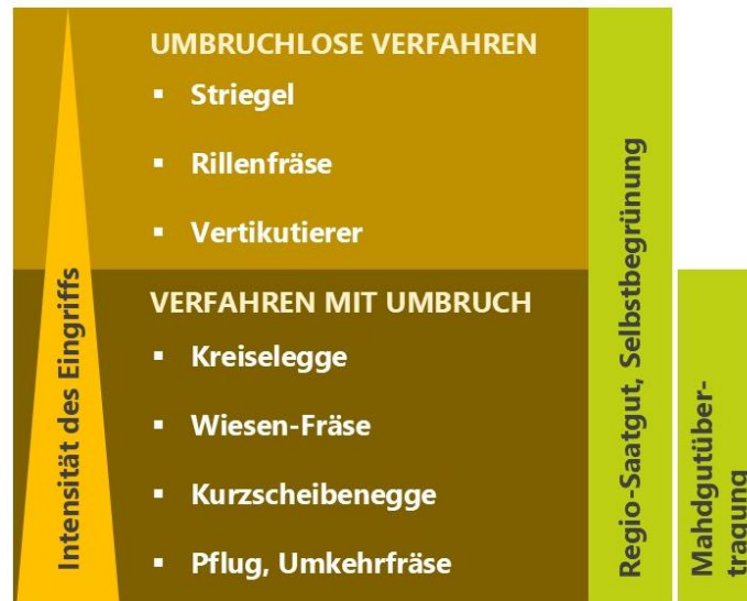
Abbildung 2: Übersicht der Bodenbearbeitungsmethoden zur Saatbettbereitung mit Darstellung der Eingriffsintensität und möglicher Begrünungsmethoden (Stiftung Naturschutz Schleswig-Holstein 2020, S. 13).

überdeckt. Das Bodenmaterial steht anschließend als Saatbett zur Verfügung (Natürlich Bayern 2020, S. 2; Stiftung Naturschutz Schleswig-Holstein 2020, S. 14).