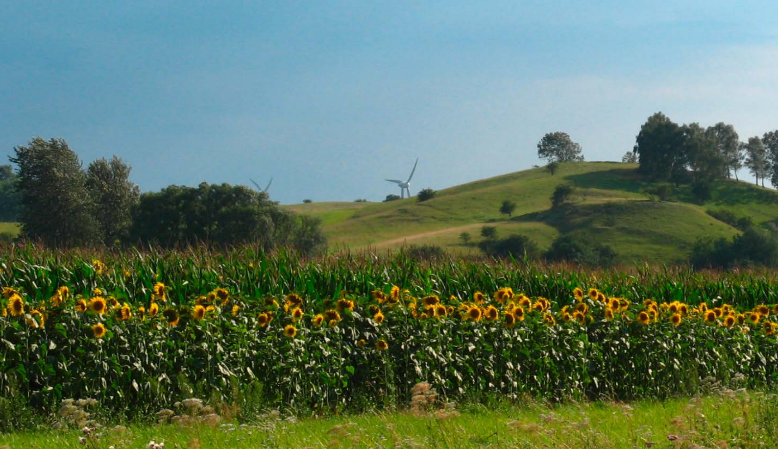
Ein Mix aus erneuerbaren Energien, der sich gut in die Landschaft einfügt