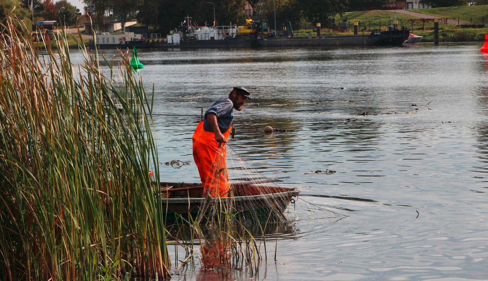
Traditioneller Fischer im Nationalpark Unteres Odertal