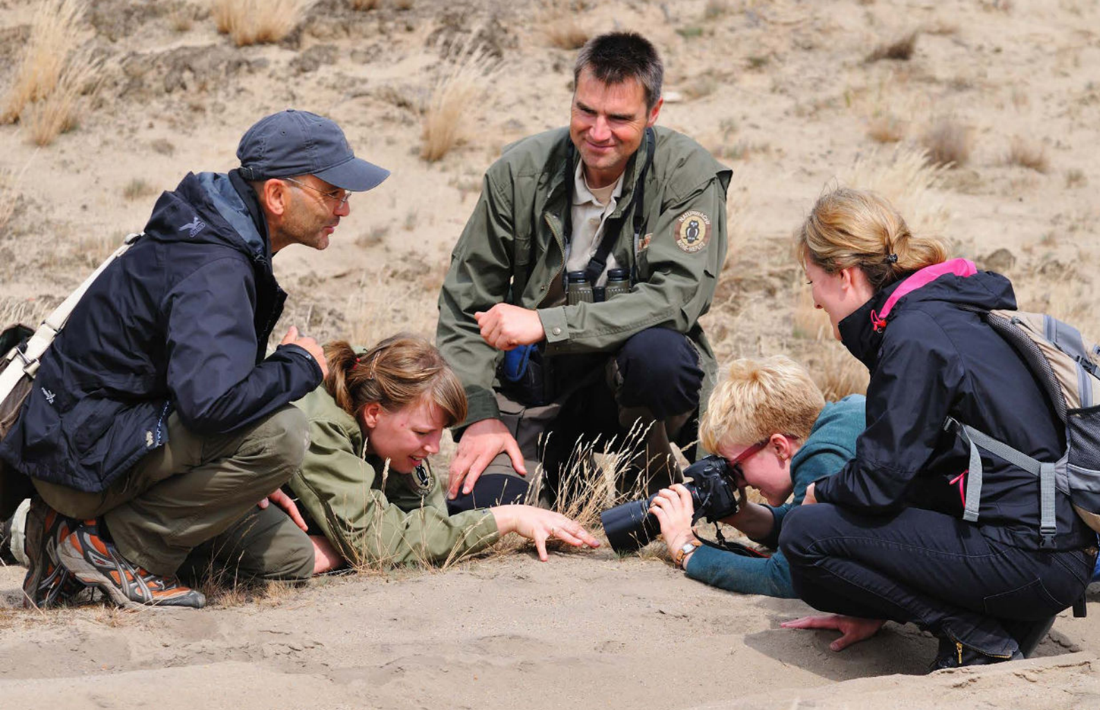
Spannende Perspektiven – Mit den Rangern Natur erleben