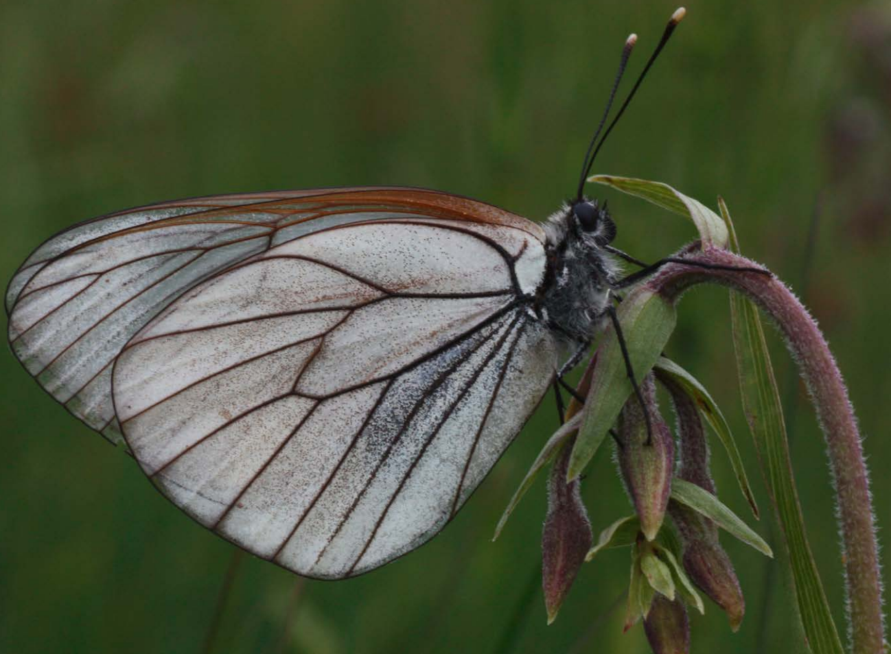
Baumweißlinge in einer artenreichen Feuchtwiese im Naturpark Märkische Schweiz

Brandenburg beherbergt vielfältige Lebensräume des Offenlandes. Hierzu zählen sowohl verschiedene Lebensräume der trockenen Sandheiden und Dünen als auch die der kontinentalen Trocken- und Halbtrockenrasen. Brandenburg verfügt über rund 40 % der Heidefläche Deutschlands und trägt damit eine besondere Verantwortung zur Sicherung und zum Erhalt dieser Flächen. Viele dieser Flä-