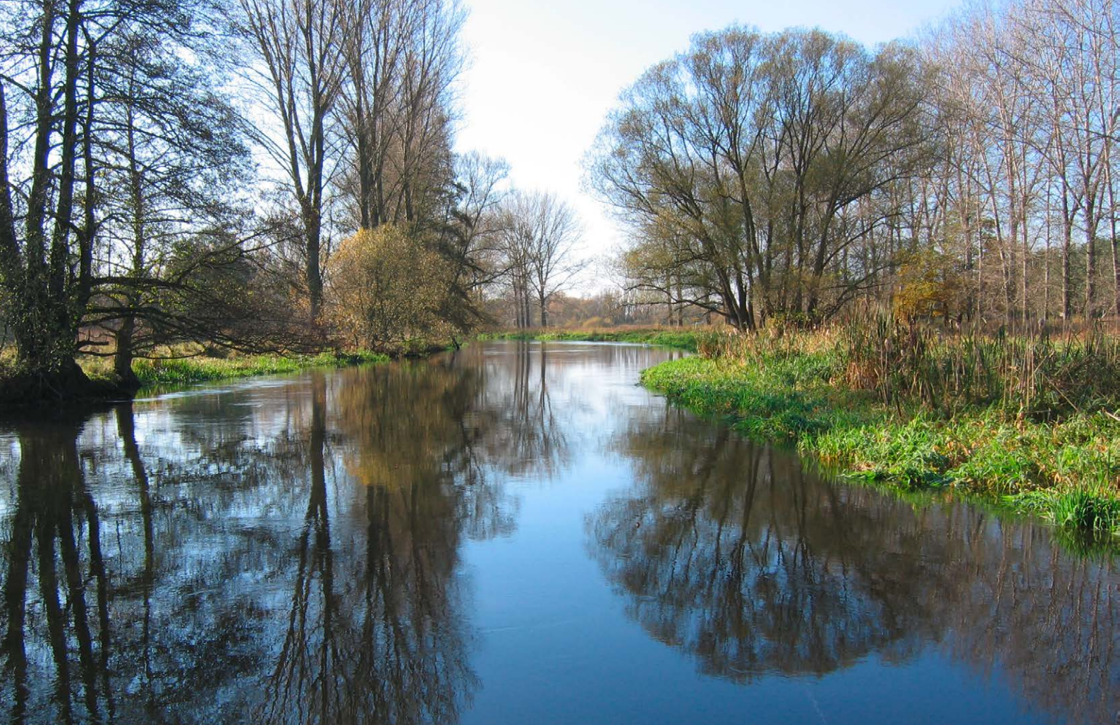
Naturnahe Fließgewässer wie die Müggelspree bei Hangelsberg sind typisch für Brandenburg.