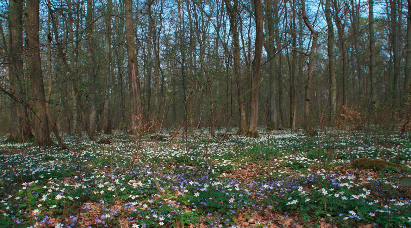
Eichen-Hainbuchenwald mit einer bunten Frühlingsflora aus Leberblümchen und Buschwindröschen bei Strausberg.