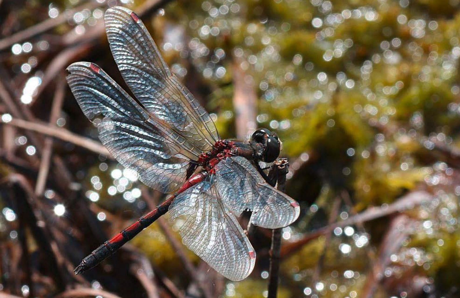
Die Nordische Moosjungfer gehört zu den Besonderheiten in Brandenburger Mooren wie hier im FFH-Gebiet Löcknitztal bei Erkner.