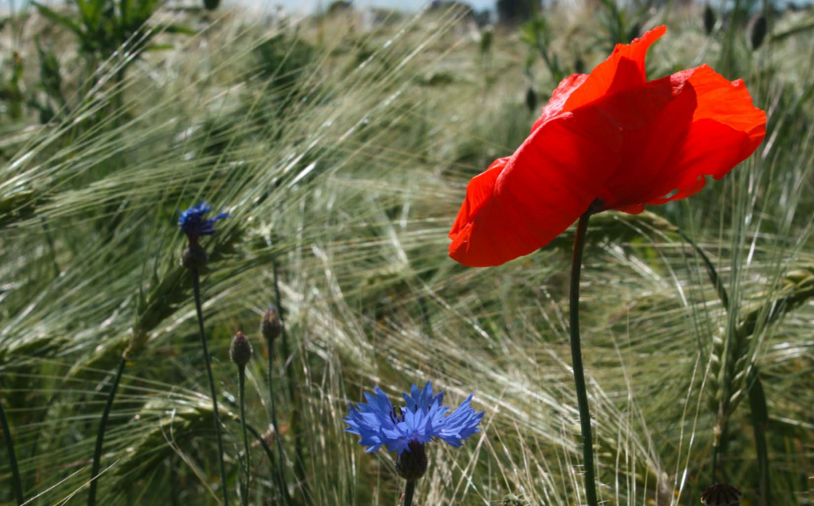
Artenreiche Feldraine bereichern die Agrarlandschaft.