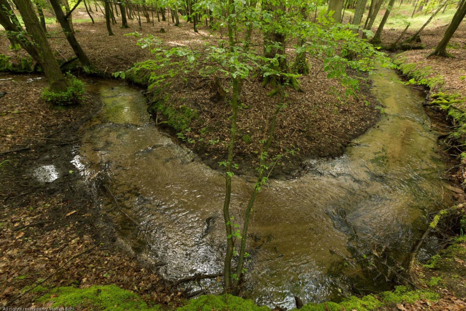
Der frei mäandrierende Polsbach im Naturpark Hoher Fläming ist Teil eines Feuchtgebietsverbundes.

Ein wichtiger Teilaspekt, insbesondere hinsichtlich des Schutzes der an Feuchtgebiete gebundenen Arten und der vom Wasser geprägten Lebensräume, ist neben dem Moorschutz der „Feuchtgebietsverbund“, d.h. ein barrierefreier Verbund von Feuchtgebieten und Gewässern. Hierbei kommt der Revitalisierung von nutzungsfreien Niedermooren, dem Erhalt naturnaher Moore und der Revitalisierung entwässerter Moore, der Wiederherstellung der Verbindung von Fluss und Aue und der Herstellung der ökologischen Durchgängigkeit von Fließgewässern eine besondere Bedeutung zu. Nicht alle Verbindungsflächen müssen als Schutzgebiete ausgewiesen werden. Mit Festlegung eines großräumigen Freiraumverbundes im Landesentwicklungsplan Berlin-Brandenburg (LEP B-B 2009), der neben weiteren hochwertigen Freiräumen alle naturschutzfachlich geschützten Gebiete umfasst, werden auch die für den Biotopverbund notwendigen Flächen überwiegend berücksichtigt. Die für die Biotopverbundfunktion wichtige Durchgän-