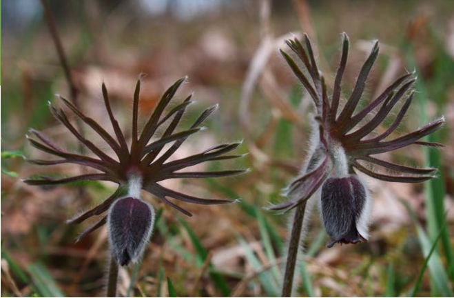
Wiesen-Kuhschelle an den Oderhängen bei Lebus