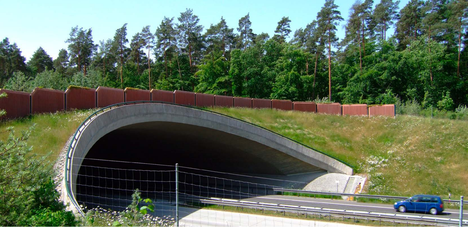
Grünbrücken wie diese an der BAB 11 zwischen Joachimsthal und Pfingstberg verbinden Lebensräume.