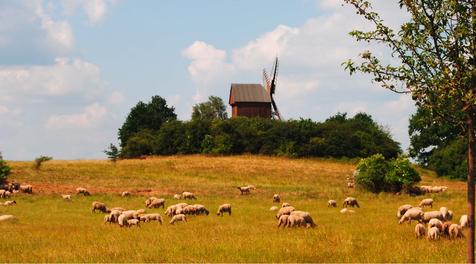
Schafbeweidung zur Pflege artenreicher Trockenrasen im Naturpark Hoher Fläming

Bestimmte Formen und Arten der Nutztierhaltung tragen unmittelbar zum Erhalt der biologischen Vielfalt bei. Dazu zählen die Schafhaltung , die Haltung von Robust- und Fleischrindern, die Wasserbüffelhaltung, aber auch die landwirtschaftliche Wildtierhaltung. Die Haltung dieser Tierarten ist durch eine extensive Flächennutzung gekennzeichnet, auf die verschiedene Lebensraumtypen und Arten angewiesen sind. Hauptsächlich durch die Aufgabe von Haupterwerbsschafhaltungen nimmt der Schafbestand in Brandenburg seit Jahren ab. Eingeleitet wurde dieser Prozess durch den Wegfall der Mutterschafprämien. Gleichzeitig verschlechterten sich die Rahmenbedingungen für den kostendeckenden Absatz von Lammfleisch und Wolle. Zu einem wichtigen wirtschaftlichen Standbein in der Schafhaltung ist die Biotop- und Landschaftspflege geworden.