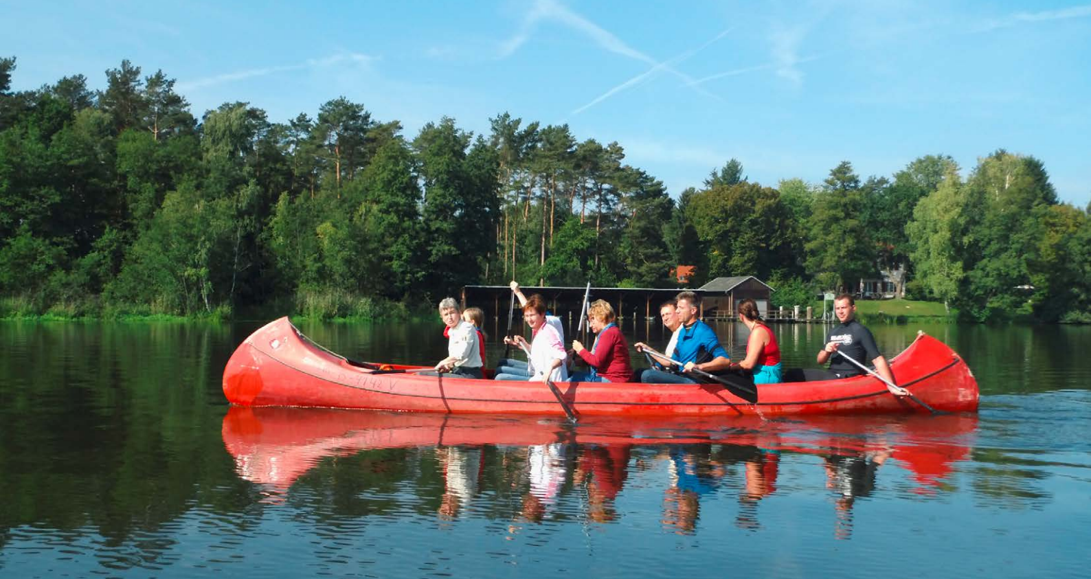
Paddeltour an der Dahme