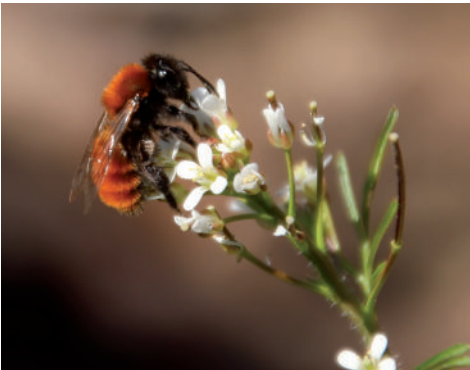
Die Wildbiene „Fuchsrote Sandbiene“ an Behaartem Schaumkraut.

Eine andere Möglichkeit besteht darin, etwa zehn cm tiefe und parallel zueinander liegende Löcher in Holzblöcke oder Stammabschnitte aus trockenem Hartholz (z. B. Esche, Eiche oder Apfelbaum) zu bohren. Die Bohrungen müssen dabei von einer Seite aus im rechten