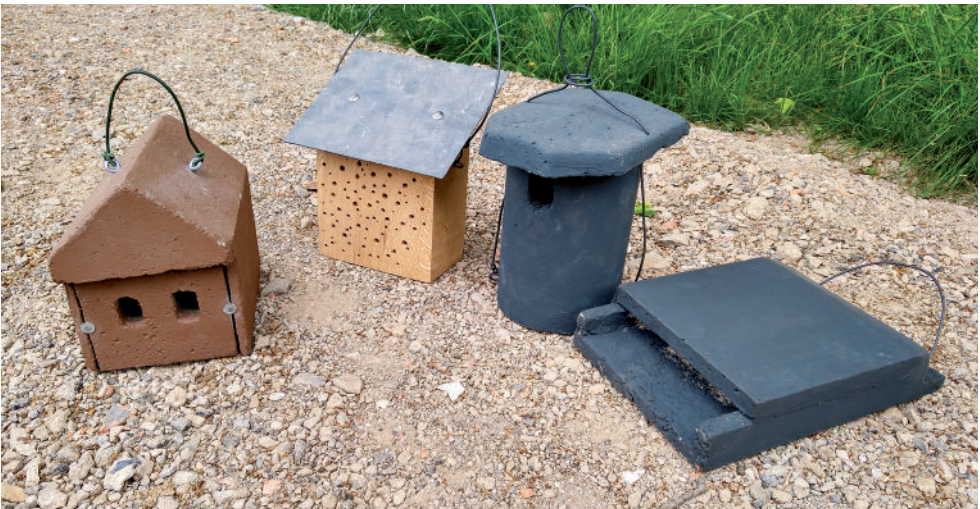
Verschiedene Nistkästen aus dem Gartenprojekt: v.l.n.r.: Nischenbrüter, Wildbienen, Höhlenbrüter, Fledermäuse.

Viele der heimischen Fledermäuse sind den Menschen in die Siedlungen und in die Kulturlandschaft gefolgt. Doch seitdem die Landschaft immer intensiver genutzt wird und Gebäude immer besser isoliert und saniert werden, bekommen Fledermäuse zunehmend Schwierigkeiten dabei, Wohnraum zu finden. Dazu kommt das Problem, dass durch das Insektensterben auch die Nahrung für Fledermäuse knapper wird.