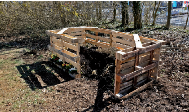
Einfach selbstgebaut: Ein Komposter aus Paletten.

Bioabfälle im eigenen Garten zu kompostieren, ist die älteste Recyclingmethode, die wir kennen. Denn die Verrottung von organischen Abfällen bildet die idealen Stoffkreisläufe in der Natur ab. Aus Küchen- und Gartenabfällen entsteht wertvoller Humus, der den Gartenboden verbessert und den Pflanzen Nährstoffe bietet. Wer Kompost als Gartendünger nutzt, erhält den Boden fruchtbar. Industrieller Dünger oder der ökologisch kritische Einsatz von Torf in Blumenerden ist damit überflüssig. Wer keinen Komposter hat, kann hochwertigen Kompost aus der Region auch beim Kompostwerk bekommen, z. B. beim Entsorgungszentrum Leppe in Lindlar-Remshagen. So schließen sich die Stoffkreisläufe nicht nur über die eigene Kompostierung im heimischen Garten, sondern auch über die Biotonne.