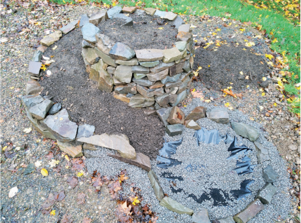
Die Kräuterspirale auf dem Gelände der VHS Oberberg - hier noch ohne Bepflanzung.

Was die Baumaterialien anbelangt, so hat man in weiten Grenzen vielfältige Auswahlmöglichkeiten an geeigneten Materialien. Lediglich frei von Schadstoffen sollten diese sein und eine gewisse Witterungsbeständigkeit aufweisen. So können beispielsweise wiederverwendete Baumaterialien zum Einsatz kommen. Gut geeignet sind Dachziegel aus Beton oder Ton, Mauersteine aus Beton, Kalksandstein oder der klassische Backsteinziegel als Grundmaterial. Ungeeignet sind Bimssteine, Leichtbeton oder Gasbeton-Bausteine. Sicherlich können auch diverse Plattenmaterialien oder Pflastersteine zweckentfremdet eingesetzt werden, unumstritten ist aber wohl ein Naturstein die beste Wahl. Dieser lässt sich nicht nur problemlos gestalterisch an die meisten Umgebungen anpassen, er bildet auch als eines der wenigen Baumaterialien ein schadstofffreies, unkompliziertes Umfeld für jegliche Bepflanzungen.