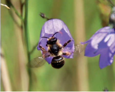
Hier hat eine Glockenblume Besuch von einer Wildbiene.