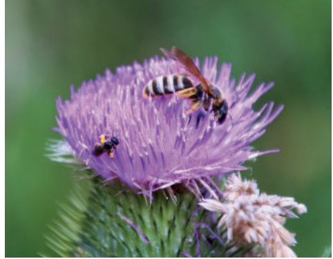
Auch die Ackerkratzdistel ist bei Wildbienen beliebt.

Winkel zur Holzfaser erfolgen, um Rissbildungen und ein Aufquellen der Fasern durch eindringende Feuchtigkeit zu vermeiden. Dabei sollten Holzbohrer von unterschiedlichen Durchmessern genutzt werden, bewährt haben sich hier ebenfalls vier bis acht mm. Der Mindestabstand zwischen den einzelnen Bohrungen sollte zwei cm nicht unterschreiten.