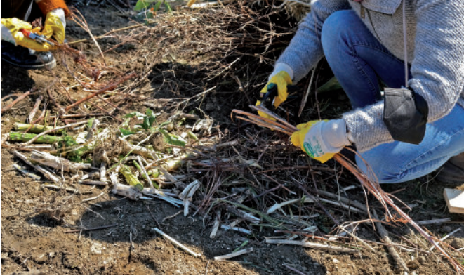
Grobe Pflanzenteile sollten vor dem Kompostieren zerkleinert werden.

Große Mengen eines einzigen Materials, z. B. Rasenschnitt, können zu Problemen auf dem Kompost führen. Eine gute Mischung der eingebrachten Reste ist wichtig. Feuchtes Material sollte mit trockenem und feinteiliger mit groben Strukturen vermischt werden. Hohlräume im Kompost ermöglichen, dass Luft nachströmt und die Bodenorganismen arbeiten können. Solche Hohlräume entstehen durch Hecken- und Gehölzschnitt oder Staudenstängel, die unter feines Material wie Rasenschnitt, Laub, Gemüsereste und Küchenabfälle gemischt werden. Damit Rasenschnitt gut verrottet, sollte er vor dem Kompostieren antrocknen, mit grobem Material gemischt und auseinandergezogen auf den Kompost aufgebracht werden.