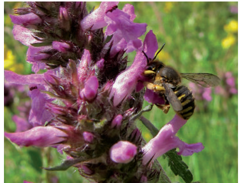
Eine Garten-Wollbiene sucht Nektar an Heil-Ziest.