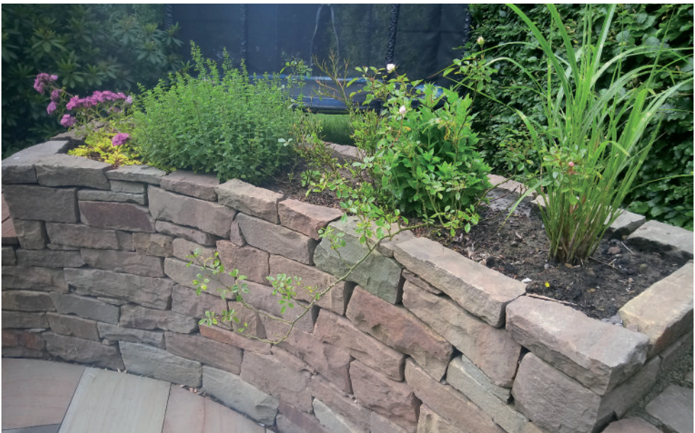
Trockenmauer als Einfassung eines kleinen Hochbeetes.

Eine detaillierte Anleitung für den Bau einer Trockenmauer findet sich in der Broschüre „Bienen, Blüten und Begegnung – Ein Leitfaden zur ökologischen Aufwertung von Dörfern“ die unter https://biostationoberberg.de/downloads.html kostenlos heruntergeladen werden kann.