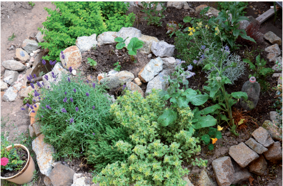
Kräuterspirale: Hübscher Blickfang und frische Kräuter auch für kleine Gärten.

Der Bau kann an die eigenen handwerklichen Fähigkeiten und Voraussetzungen angepasst werden. Für kleine Gärten oder Balkone bietet sich eine eher kompakt gehaltene Spirale an, die gerade Platz für die nötigsten Küchenkräuter vorhält. Wer mehr Fläche zur Verfügung hat, kann auf eine große Spirale mit vollem Sortiment und breiter Pflanzenauswahl setzen. Natürlich entscheiden nicht zuletzt die örtlichen Rahmenbedingungen darüber, wie viel Platz für den Bau zur Verfügung steht. Auch der ästhetische Aspekt sollte nicht zu kurz kommen, wirkt doch eine zu klein gebaute Spirale in einem großzügigen Garten eher verloren, oder eine überdimensionierte Version im Kleingarten ebenso fehl am Platze.