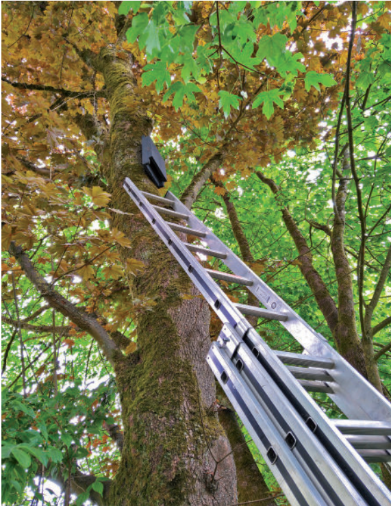
Vier bis fünf Meter hoch aufgehängt bietet ein Flachkasten Fledermäusen ein sicheres Quartier.

Es können mehrere Kästen in kleinen Gruppen am Gebäude oder an Bäumen montiert werden. Dabei sollten Sie diese am besten in verschiedene Himmelsrichtungen ausrichten.