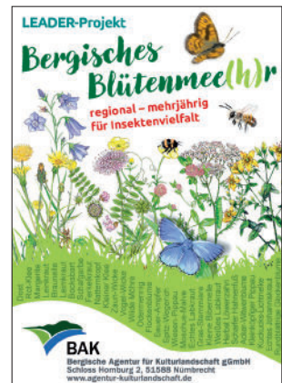
Das „Bergische Blütenmee(h)r“: Beispiel einer regionalen Blümmischung für das Bergische Land.

Hat sich die Blumenwiese etabliert, muss sie gepflegt werden. Das betrifft auch mehrjährige Blumenwiesen. Die Flächen sollten ein bis zwei Mal im Jahr gemäht und das Mahdgut abgetragen werden. Der früheste Schnitt sollte dabei erst ab Mitte Juni erfolgen. Je nach Zuwachs kann dann nochmal Ende August bzw. im September gemäht werden. Es ist empfehlenswert, immer einen Teilbereich des Aufwuchses stehen zu lassen. Auf diese Weise haben Insekten auf der Fläche einen Rückzugsort und in den Stängeln nistende Tiere werden geschont. Die stehen gelassenen Teilbereiche können dann bei der Mahd im Folgejahr mit gemäht werden. Bei dieser Mahd wird dann ein anderer Teilbereich stehen gelassen.