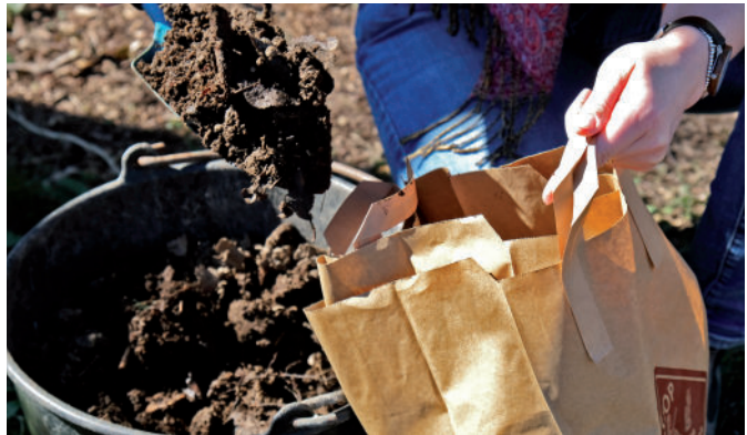
Jetzt ist er fertig: Feinkrümeliger Kompost.

In der Mitte des Kompostes laufen die Abbauprozesse aufgrund der höheren Temperaturen schneller ab. Durch das Umsetzen vermischen sich die verschiedenen Rottestufen und nach ungefähr einem Jahr ist der Kompost reif und kann im Garten eingesetzt werden.