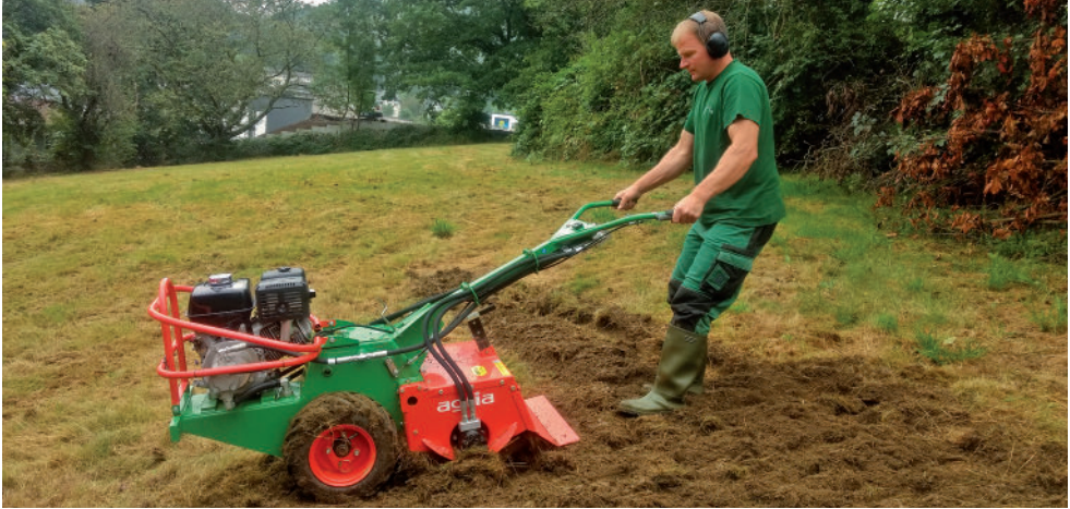
Eine sogenannte Umkehrfräse erleichtert die Vorbereitung des Saatbettes.

festgedrückt werden. Anschließend sollte die Fläche für zwei bis drei Wochen feucht gehalten werden.