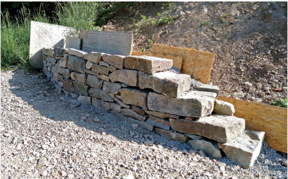
Die Trockenmauer auf dem Gelände der VHS Oberberg im Bau.