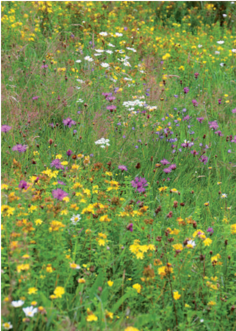
Farbenprächtige Blühwiese, angelegt mit mehrjährigen heimischen Pflanzenarten.

Immer häufiger berichten Medien über den Insektenrückgang. Möchten Sie sich aktiv für den Schutz von Insekten einsetzen? Dann ist oft die Anlage von Blumenwiesen ein Mittel der Wahl. Doch genau dabei gibt es einiges zu beachten: