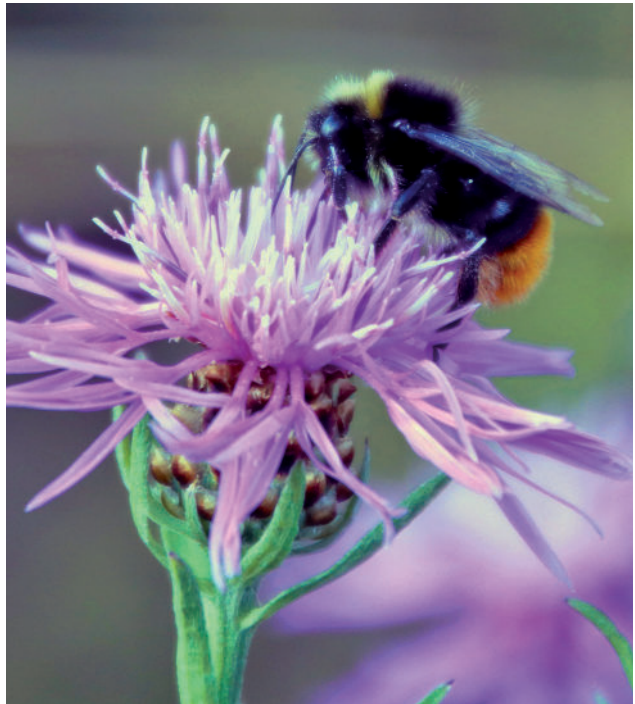
Wiesenhummel auf Wiesen-Flockenblume.

Albert Einstein soll einmal gesagt haben, dass, wenn die Bienen aussterben würden, auch die Menschheit dem Untergang geweiht sei. Dieses Urteil müsste eigentlich eher noch für die Hummel gelten. Denn die Hummelarten sind sogar noch „fleißigere“ Bestäuber als viele andere Wildbienenarten und die Honigbienen. Vielleicht dank ihrer Körperfülle fliegen sie schon bei 3 Grad Außentemperatur, Regen- oder Graupelschauern aus, um Blüten zu besuchen. Damit leisten Hummeln einen enormen Beitrag, damit Pflanzen Früchte hervorbringen können.