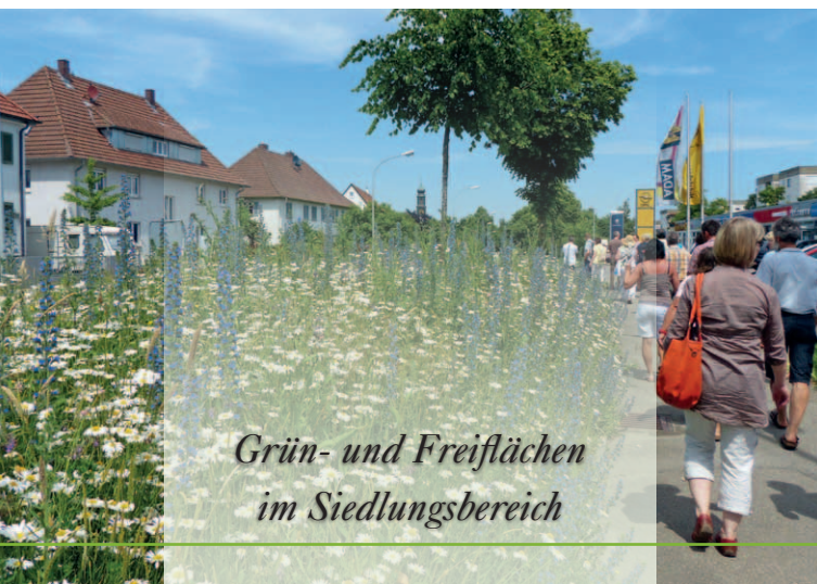
Grün- und Freiflächen im Siedlungsbereich

Das Bündnis „Kommunen für biologische Vielfalt“ will die Kommunen dabei unterstützen, dieses Potential für Mensch und Natur zu fördern.