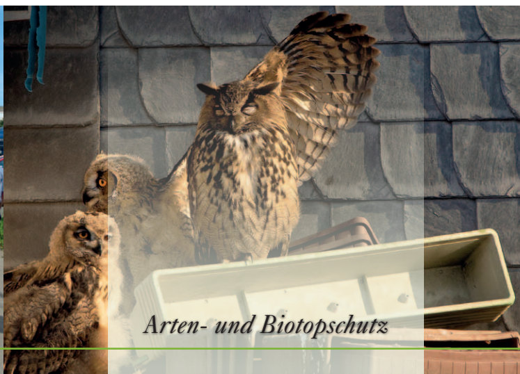
Arten- und Biotopschutz