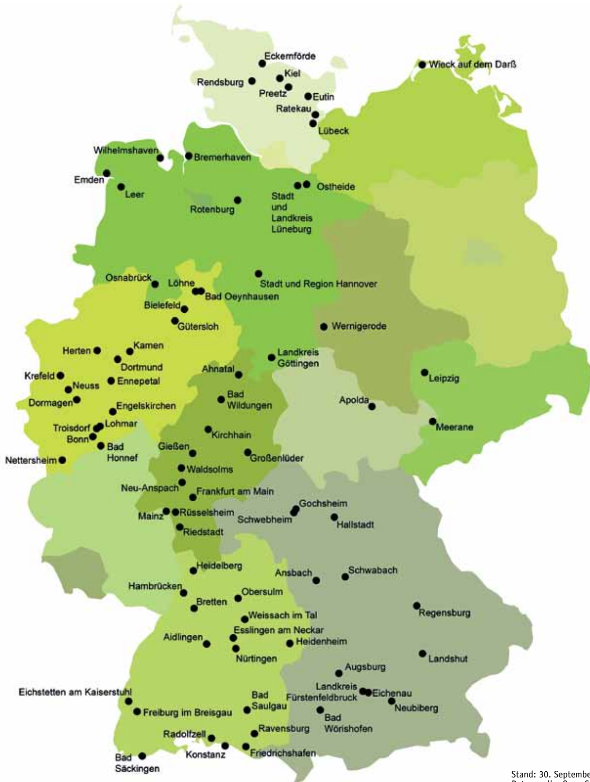
Stand: 30. September 2012 Datenquelle: Open Street Map