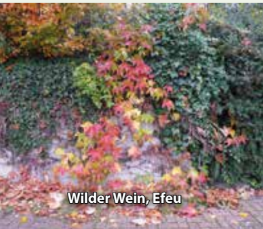
Wilder Wein, Efeu