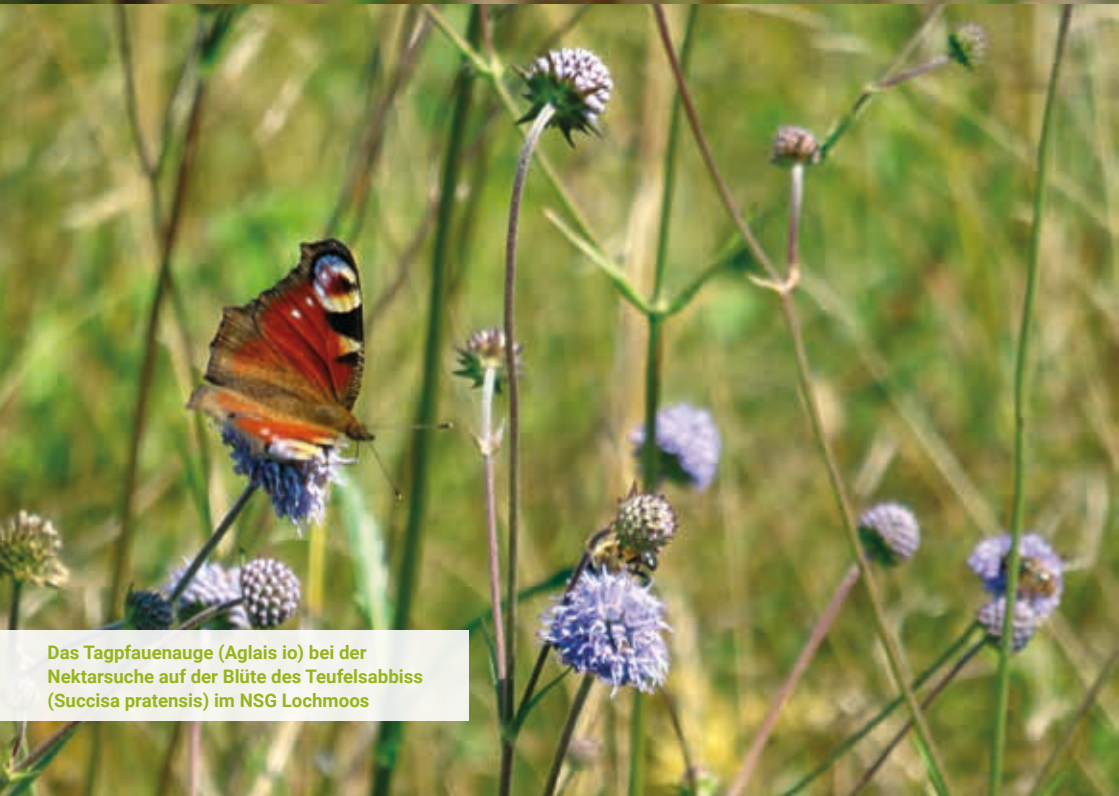
Das Tagpfauenauge ( Aglais io ) bei der Nektarsuche auf der Blüte des Teufelsabbiss ( Succisa pratensis ) im NSG Lochmoos