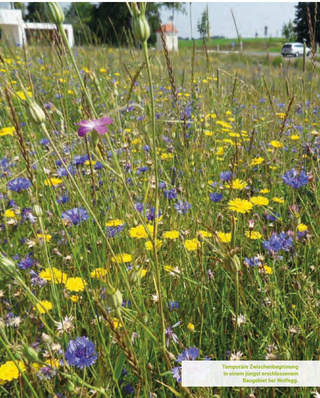
Temporäre Zwischenbegrünung in einem jüngst erschlossenem Baugebiet bei Wolfegg.