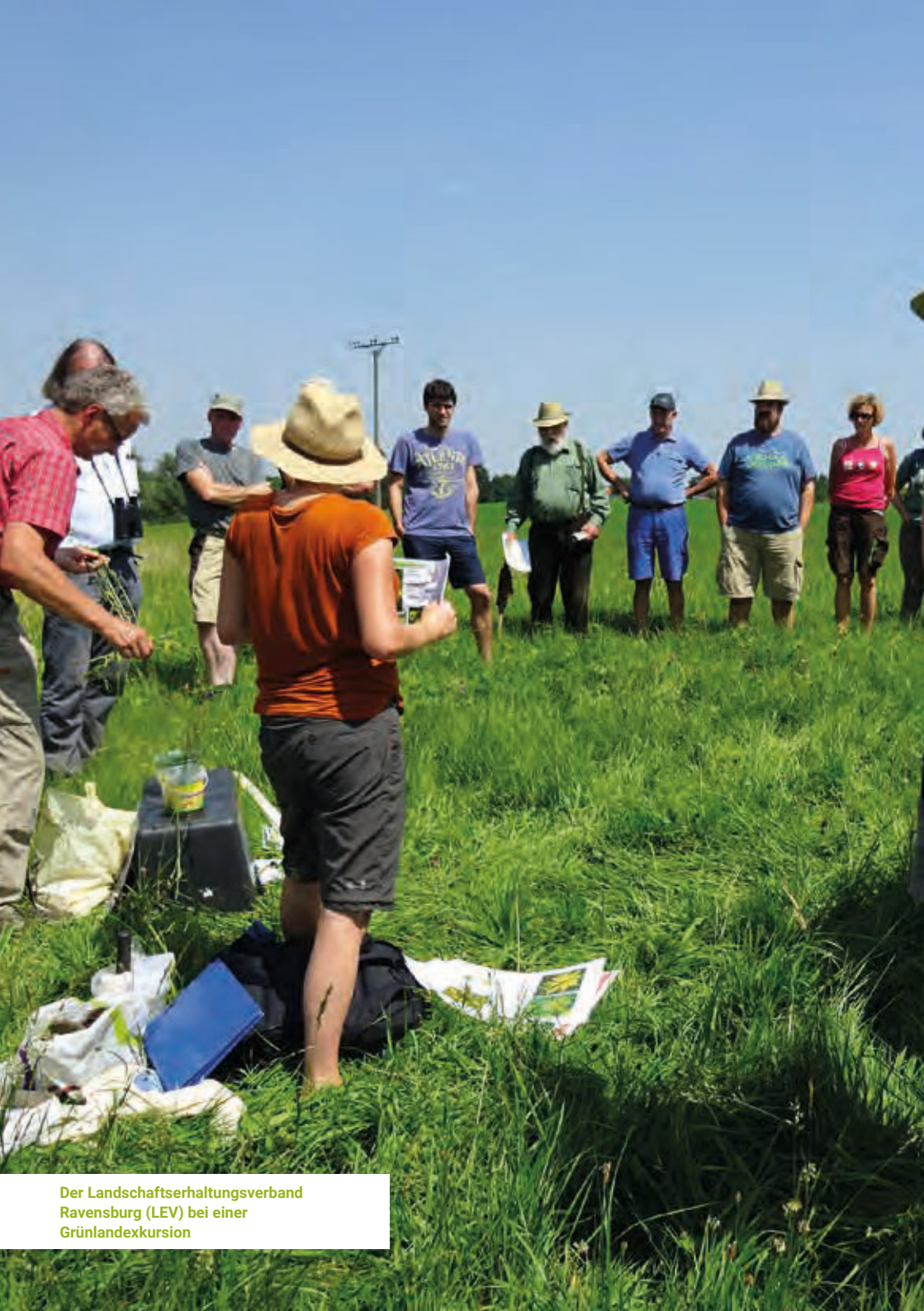
Der Landschaftserhaltungsverband Ravensburg (LEV) bei einer Grünlandexkursion