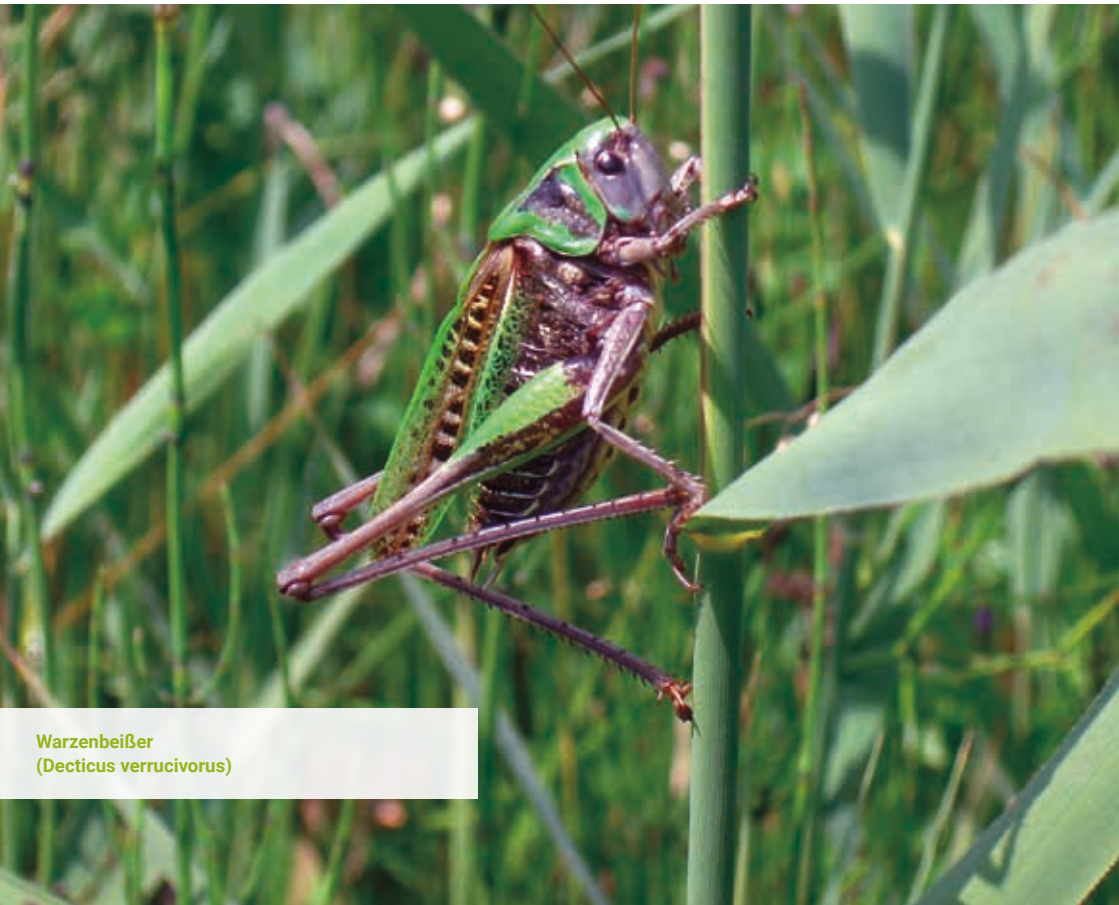
Warzenbeißer ( Decticus verrucivorus )

Die Strategie zur Stärkung der biologischen Vielfalt orientiert sich an den Akteuren und Flächen, die wesentliches Erhaltungs- und Entwicklungspotenzial für die Biodiversität aufweisen. Die Projekte und Aktivitäten konzentrieren sich vor allem auf die Handlungsmöglichkeiten der Landkreisverwaltung, der Städte und Gemeinden, der Landwirte, der Privatgartenbesitzer sowie der Unternehmen.