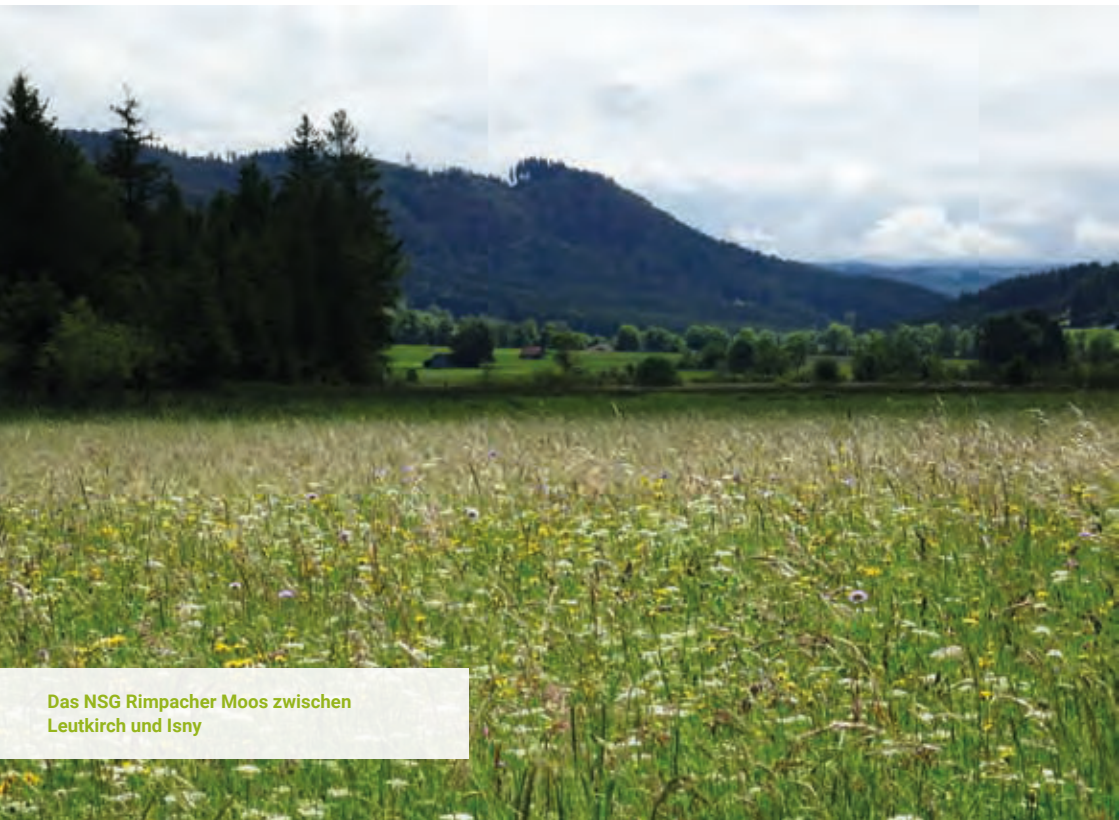
Das NSG Rimpacher Moos zwischen Leutkirch und Isny

Der Landkreis Ravensburg zeichnet sich durch eine besonders vielgestaltige Landschaft und eine große Vielfalt an Lebensräumen aus. Die zahlreichen Schutzgebiete, der gut etablierte Vertragsnaturschutz sowie die Kompetenz und das Engagement der öffentlichen und privaten Naturschutzakteure im Landkreis bilden eine starke Basis für den Erhalt und die künftige Entwicklung der Biodiversität.