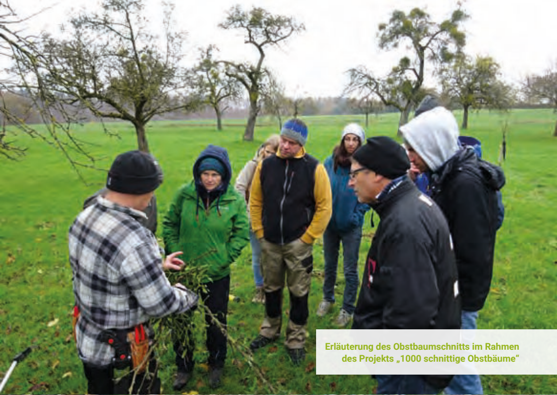
Erläuterung des Obstbaumschnitts im Rahmen des Projekts „1000 schnittige Obstbäume“