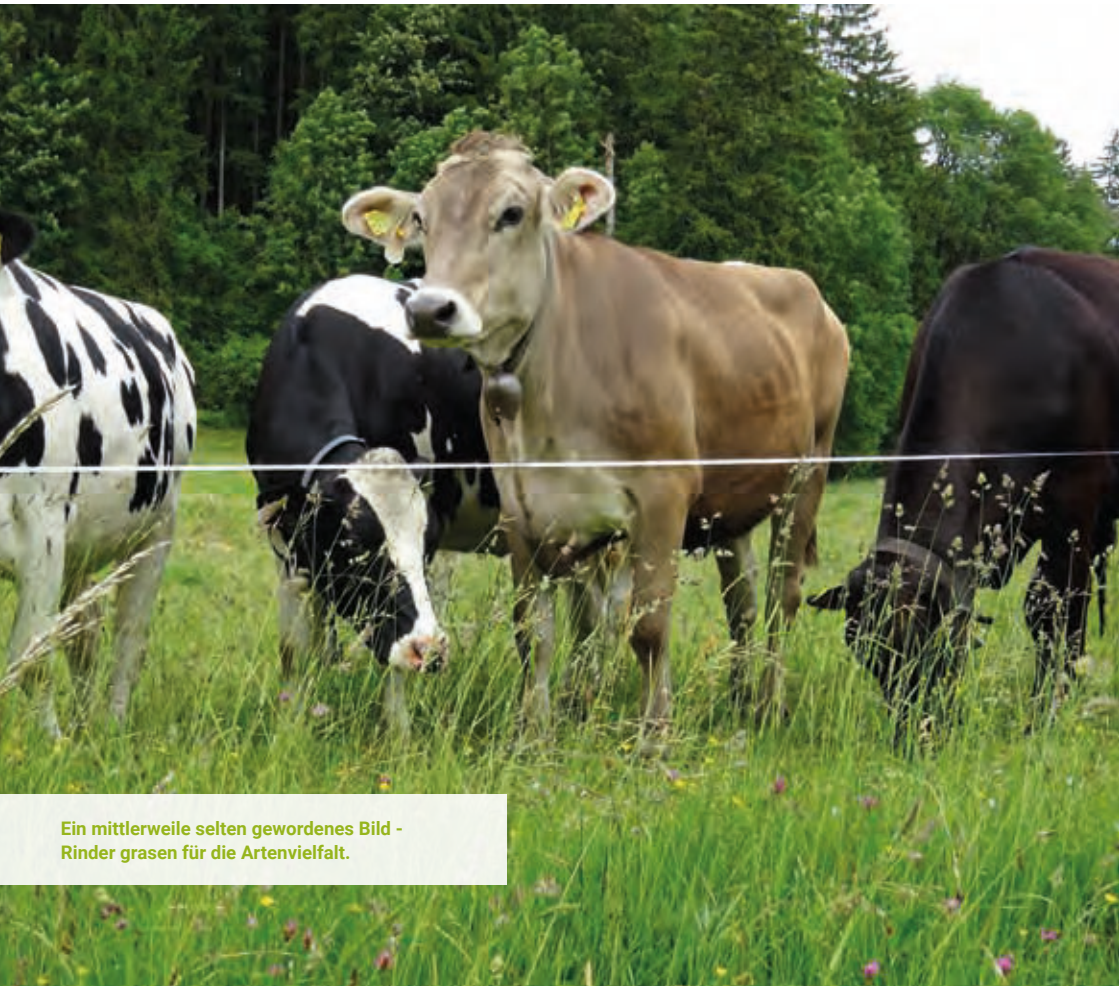
Ein mittlerweile selten gewordenes Bild - Rinder grasen für die Artenvielfalt.

Der Landkreis Ravensburg wird sein Handeln, seine Flächenbewirtschaftung und seine Projekte stärker an den Erfordernissen der Biodiversität ausrichten und so weitere Akteure einbinden und vernetzen. Insgesamt werden das Bewusstsein und die Motivation für die biologische Vielfalt gesteigert.