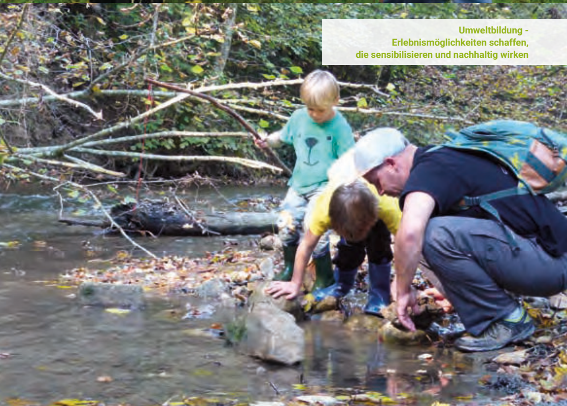
Umweltbildung - Erlebnismöglichkeiten schaffen, die sensibilisieren und nachhaltig wirken