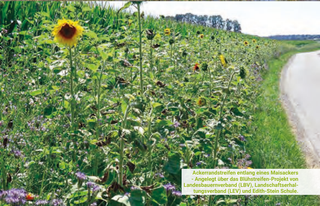
Ackerrandstreifen entlang eines Maisackers - Angelegt über das Blühstreifen-Projekt von Landesbauernverband (LBV), Landschaftserhal- tungsverband (LEV) und Edith-Stein Schule.