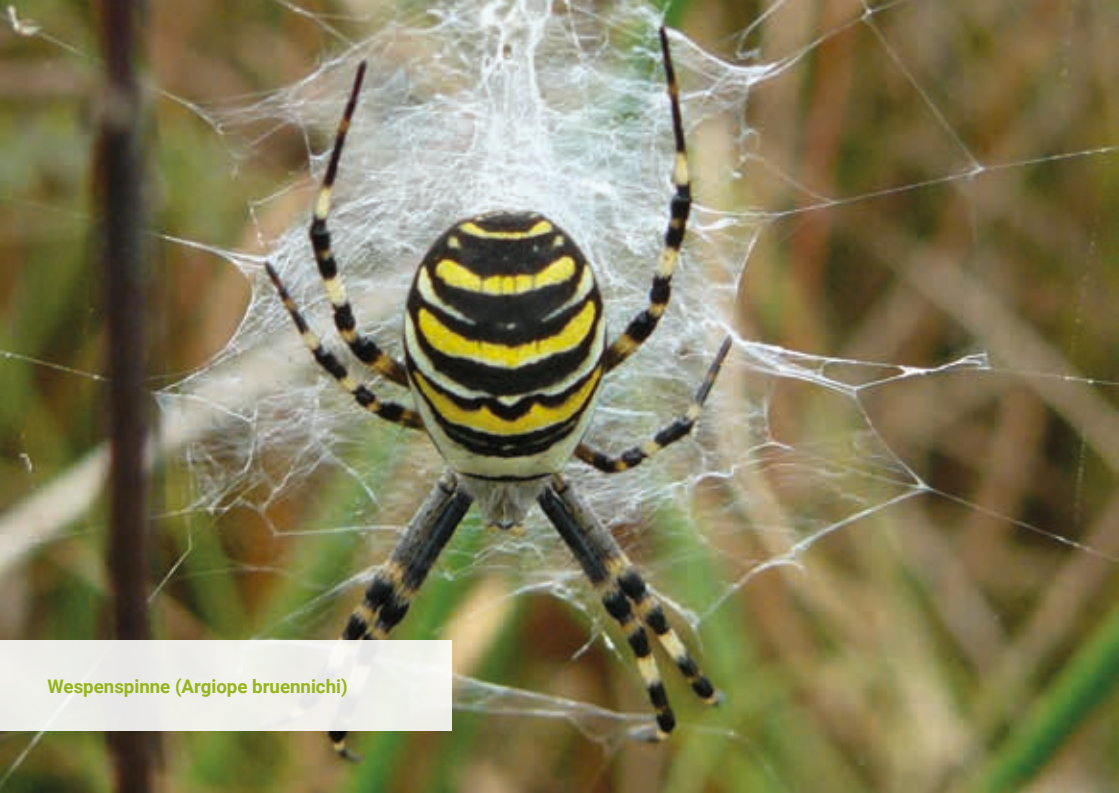
Wespenspinne ( Argiope bruennichi )