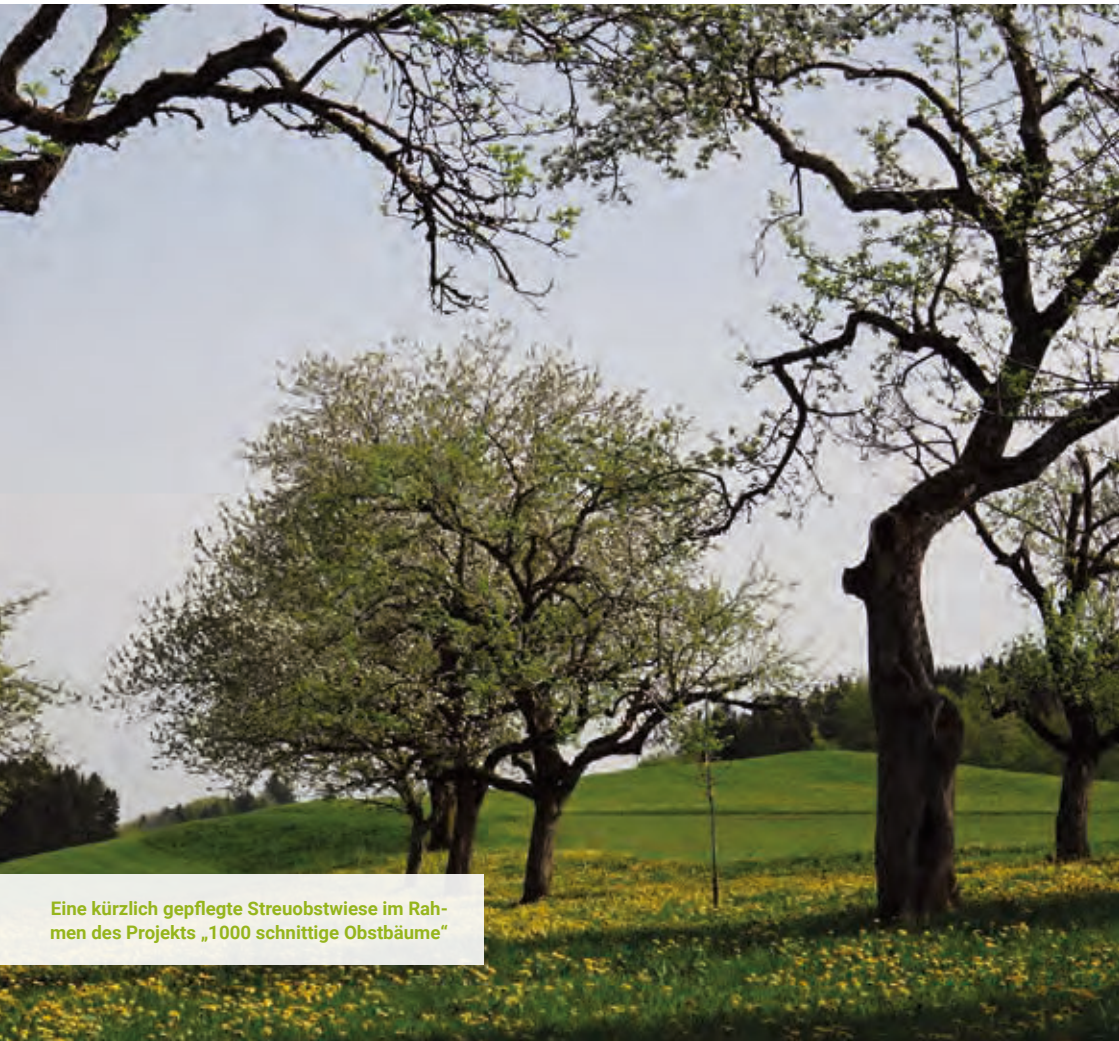
Eine kürzlich gepflegte Streuobstwiese im Rahmen des Projekts „1000 schnittige Obstbäume“

Der Landkreis stellt Mittel und Infrastruktur bereit, damit die Strategie zur Stärkung der biologischen Vielfalt langfristig Bestand hat und alle relevanten Akteure an der Umsetzung und Fortentwicklung teilhaben können.