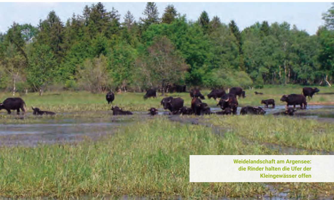
Weidelandschaft am Argensee: die Rinder halten die Ufer der Kleingewässer offen