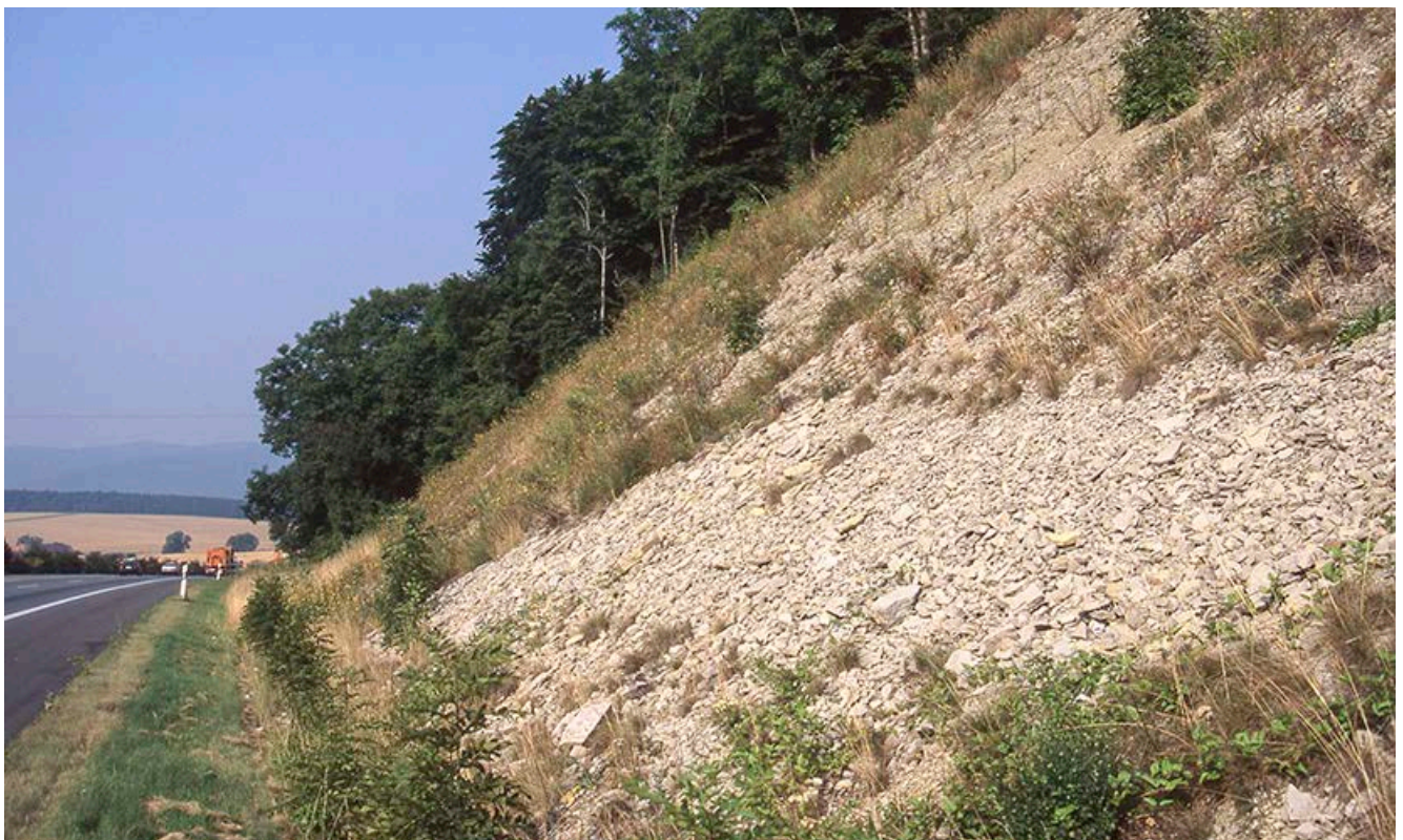
Beispiel für einen künstlich geschaffenen Rohbodenstandort entlang einer Straße

Eine Möglichkeit, die Artenvielfalt entlang von Straßen zu erhöhen, stellt das Schaffen von Rohbodenstandorten dar. Auf solchen nährstoffarmen Standorten kommen in der Regel mehr Pflanzenarten vor als auf nährstoffreichen. Zudem handelt es sich dabei häufig um Arten, die speziell an magere, nährstoffarme Standortverhältnisse angepasst und aus naturschutzfachlicher Sicht besonders wertvoll und interessant sind. Eine Option zur Schaffung von Rohbodenstandorten stellt das Abtragen von nährstoffreichem Oberboden dar, etwa im Zuge von Straßenausbaumaßnahmen. Dabei werden mit schwerem Gerät die obersten Schichten der Böschung entfernt und andernorts wieder eingebaut. Durch die Erhaltung freigelegter Felsbänder, Gesteinsanschnitte und steiler Erdkanten können insbesondere für Kleintiere interessante Sonderstandorte wie z.B. kleinflächige Trockenbiotop entstehen. Bei Neubaumaßnahmen können durch den weitgehenden Verzicht einer Bodenandeckung (max. 5 cm Mächtigkeit) offene Rohboden- und Magerstandorte geschaffen werden. Der zur Andeckung vorgesehene Oberboden sollte in der Nähe seiner Herkunft über entsprechendem Gesteinsuntergrund auf angrenzenden Straßenböschungen mit ähnlichem Entwicklungsziel verteilt werden. Durch die Wiederausbreitung des Oberbodens gelangen viele Sporen und Samen der vorherigen Pflanzendecke auf die Böschungen, was die Entwicklung eines standortgemäßen Vegetationsgefüges erheblich beschleunigen kann.