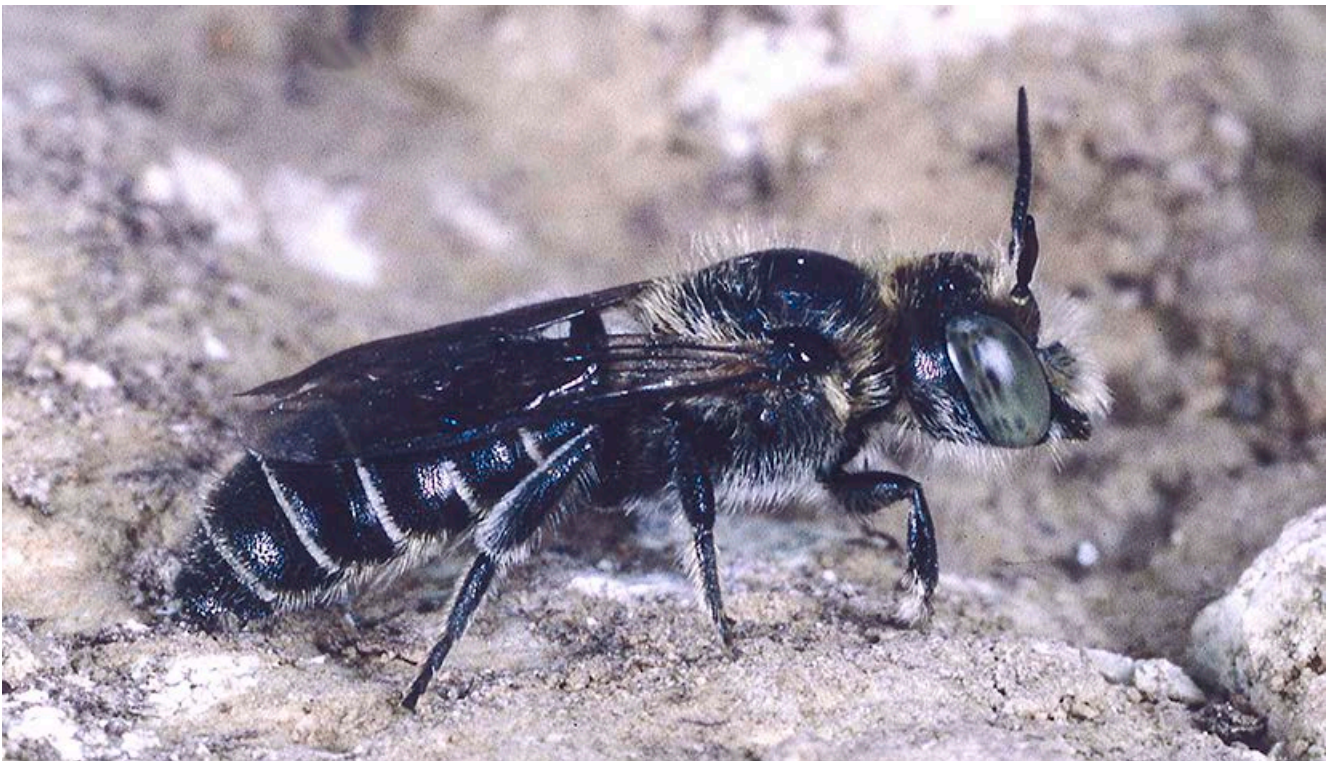
Die auf den Gewöhnlichen Natternkopf angewiesene Natternkopf-Mauerbiene

Ein großes Problem für einige Insektenarten stellt zudem die kurze Zeitspanne dar, in der sie Nahrung aufnehmen können bzw. in der ihnen ihre Wirtspflanze zur Verfügung steht. Verschwindet diese – beispielsweise durch großflächige, frühzeitige Mahd – besteht für sie keine Möglichkeit, genug Nahrung zum Überleben zu finden. Dies kann zu großen Verlusten führen. Eine Möglichkeit, die Lebensbedingungen zu verbessern, stellt die Ansaat von Blühflächen und Blühstreifen dar. Sie dienen der Förderung des Blütenangebots und bieten außerdem einer Vielzahl von Käfern, Wanzen, Fliegen und Spinnen einen Lebensraum. Diese wiederum stehen Vögeln und anderen insektenfressenden Tierarten als Nahrungsquelle zur Verfügung. Zudem profitieren Vögel vom reichlichen Angebot an Pflanzensamen. Auch können Blühflächen und Blühstreifen – bei entsprechender Anbindung und Abmessung – einen Beitrag zum Biotopverbund leisten und der Nützlingsförderung dienen.