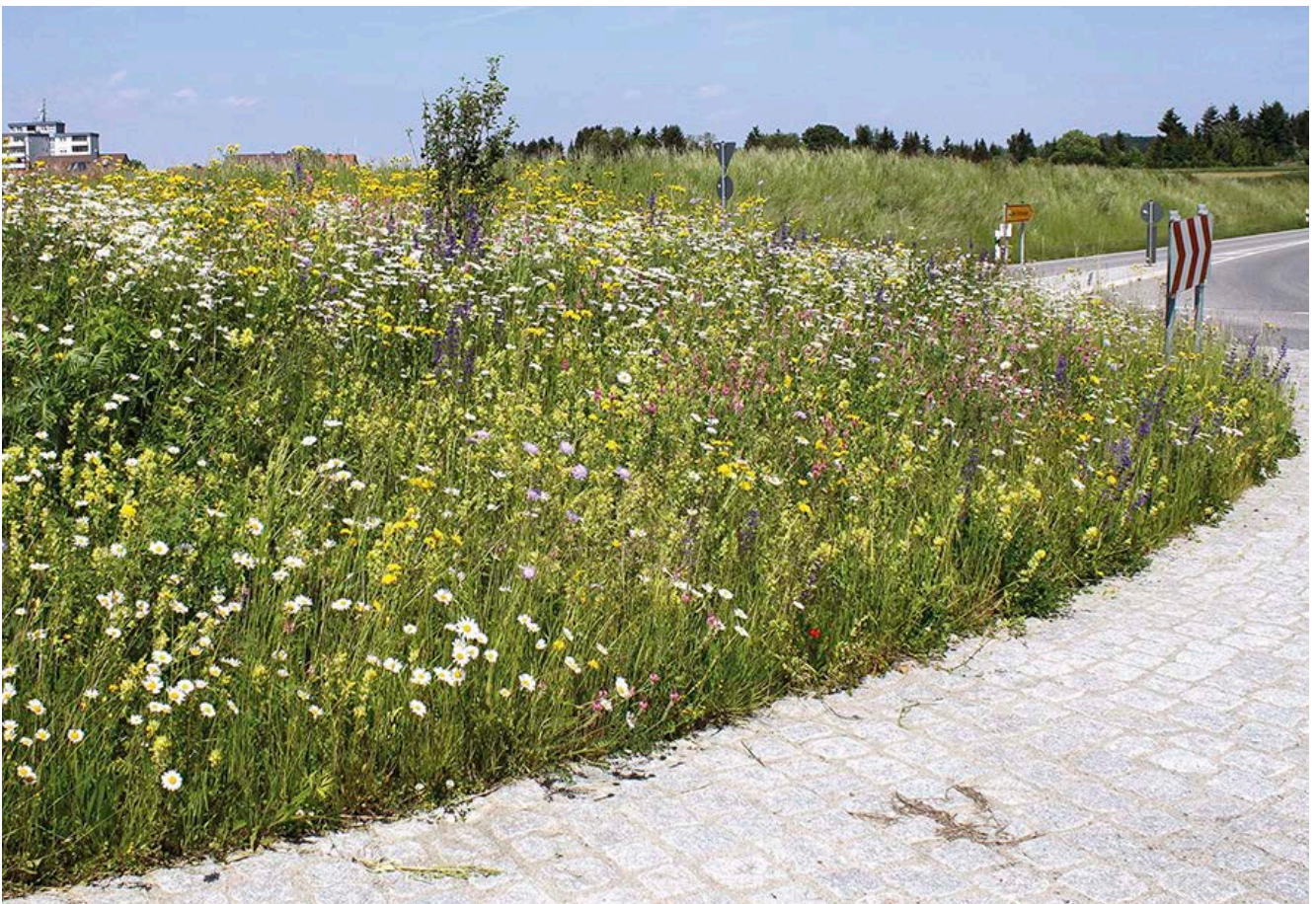
Blühfläche auf einer Verkehrsinsel bei Bad Saulgau (Lkr. Sigmaringen)

In Regionen mit intensiver Landnutzung ist der ökologische Effekt von Blühflächen und Blühstreifen größer als in Regionen mit extensiver Landnutzung, in denen Tieren und Pflanzen eine größere Vielfalt an Lebensräumen zur Verfügung steht. Als mögliche Standorte zur Ansaat von Blühflächen und -streifen entlang von Straßen können praktisch alle Flächen außerhalb des Intensivbereichs – wie etwa Böschungen, Verkehrsinseln oder Anschlussohren – dienen. Besonders geeignet sind sonnige Standorte, da durch zu starke Beschattung die Entwicklung der Pflanzen behindert werden kann. Die Breite von Blühflächen und -streifen sollte fünf Meter nicht unterschreiten. Je breiter sie angelegt werden, desto mehr Lebensraum bieten sie. Bei der Auswahl des Standorts muss zudem beachtet werden, dass dieser zur Reduktion der anfallenden Unterhaltungskosten maschinell gepflegt werden kann. Aus naturschutzfachlicher Sicht besonders interessant ist die Ansaat auf mageren Standorten, da die für diese Flächen verwendeten Saatmischungen in der Regel auch seltenere, eher konkurrenzschwache Arten enthalten. Diese wiederum können unter anderem Insektenarten als Nahrungsquelle dienen, deren Spektrum auf wenige Pflanzenarten eingeschränkt ist. Außerdem kommen auf mageren Standorten weniger Unkräuter vor, die eine erfolgreiche Entwicklung von Blühflächen – vor allem in der sensiblen Etablierungsphase – beeinträchtigen könnten.