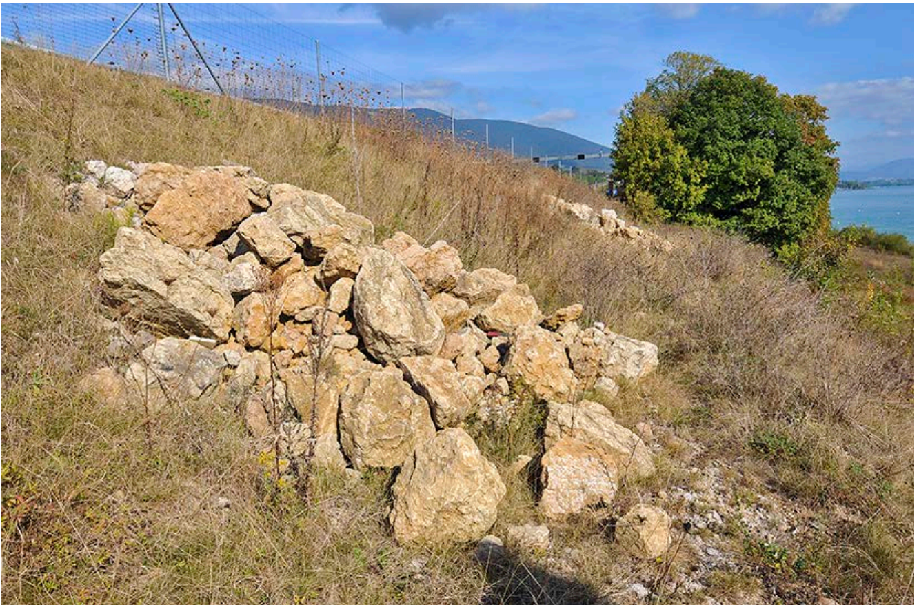
Neu angelegter Steinhaufen entlang einer Autobahnböschung in der Schweiz

Der Unterhaltsaufwand solcher Kleinstrukturen ist im Allgemeinen sehr gering. Zu beachten ist, dass aufkommendes Gebüsch nach Bedarf entfernt wird.