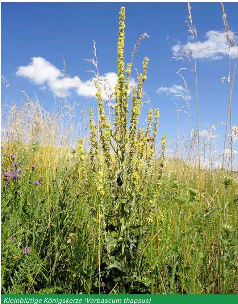
Kleinblütige Königskerze ( Verbascum thapsus )

Unterschieden wird zwischen ein-, über- und mehrjährigen Blühmischungen. Als ökologisch besonders wertvoll haben sich Ansaaten mit mehrjährigen Saatmischungen erwiesen. Diese sind in der Regel sehr artenreich, um möglichst lange und vielfältige Blühaspekte („Trachtfießband“) zu gewährleisten. Zumeist enthalten sie einen höheren Anteil an Saatgut von Wildarten, die in den intensiv genutzten Kulturlächen häufig nicht mehr vorkommen. Für Wildbienen – im Allgemeinen für „Spezialisten“ – sind solche Wildarten besonders wichtig, da sich ihre Mundwerkzeuge über Jahrmillionen an diese angepasst haben. Mehrjährige Blühmischungen können bei günstigen Standorteigenschaften ggf. ohne Pflegemaßnahmen über mehrere Jahre stehen bleiben. Daher bieten sie vielen Insekten und anderen Tieren, die sich dort einfinden, neben einem reichen Nahrungsangebot auch Möglichkeiten zum Überwintern, zum Nestbau oder zur Eiablage. Als Beispiel kann hier die Dreizahn-Mauerbiene ( Osmia tridentata ) genannt werden. Diese Wildbienenart nutzt dürre, markhaltige Stängel, etwa der Königskerze ( Verbascum spec. ), um darin ihr Nest zu bauen und ihre Eier abzulegen.