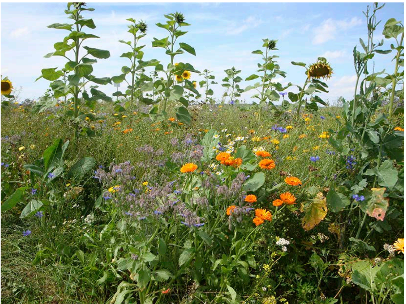
Mehrjährige Blümmischung im ersten Jahr

Grund für eventuell auftretende Beschwerden ist die etwas „spezielle“ Ästhetik, die mehrjährige Blühflächen, vor allem im Winter, auszeichnet. Wie bereits erwähnt, werden solche Flächen unter Umständen über mehrere Jahre nicht gepflegt und bleiben die komplette Zeit über stehen. Im Frühjahr und Sommer der ersten Jahre erscheinen sie vielfältig und farbenfroh, da immer irgendwelche Arten blühen.