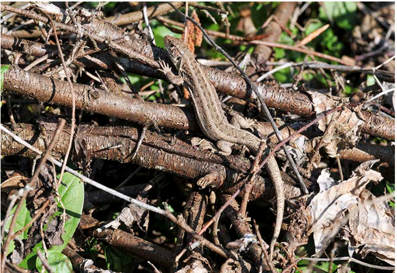
Weibliche Zauneidechse sonnt sich in einem Asthaufen

Einen ähnlich positiven Effekt wie die Anlage von Holzhaufen hat das Liegenlassen von nicht zu feinem Schnittgut aus Gehölzpflegemaßnahmen. Auch dieses verrottet und bietet einer Vielzahl von Tier- und Pflanzenarten einen Lebensraum, auch wenn bei dieser Maßnahme im Allgemeinen weniger strukturierte Sonderstandorte entstehen. Des Weiteren können ganze Bäume, die etwa im Zuge einer Auslichtung von Gehölzflächen entlang von Straßen entnommen werden, auf der Fläche verbleiben. Gleiches gilt für Einzelgehölze, die aufgrund verkehrssicherheitstechnischer Gründe gefällt werden mussten. Hier muss darauf geachtet werden, dass die Verkehrssicherheit nicht beeinträchtigt wird.