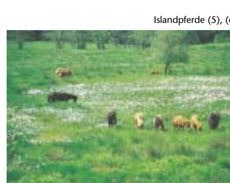
Islandpferde (5), (6)

Islandpferde werden von Anfang Juni bis Ende August ins Hühnerfeld getrieben, fressen das Pfeifengras ab und schädigen den Adlerfarn vor allem durch Tritt. Seit Beginn der Beweidung 1993 wurden die großen Adlerfarnflächen deutlich verkleinert. Mehrjährige Adlerfarn-Mahd auf Versuchsflächen reduzierte den Adlerfarn zwar auch, jedoch etablierten sich hier längst nicht so schnell andere Pflanzenarten, wie in beweideten Flächen.