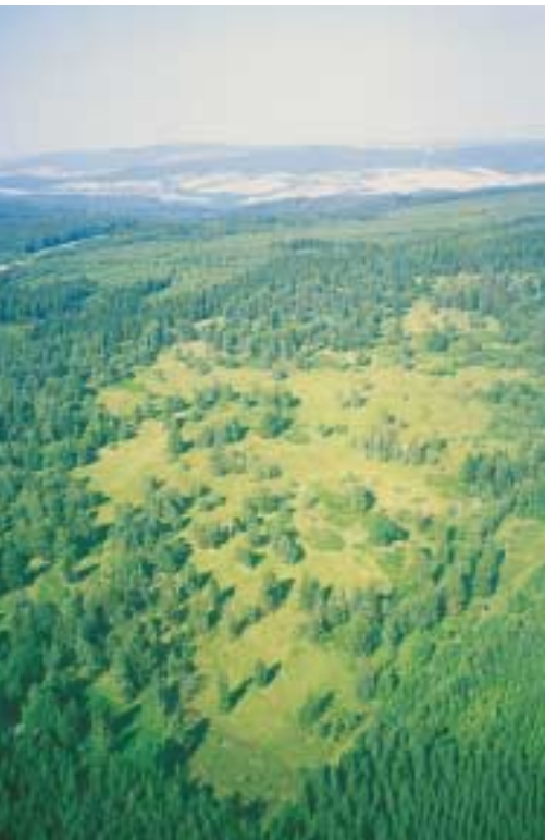
Blick nach Nordosten auf das Hühnerfeld, August 2001 (3)

Bereits vor ca. 400 Jahren begann die Stadt Hann. Münden, die Hochfläche des Kaufunger Waldes mit dem Hühnerfeld vom Rinderstall aus als Hutung für Jungvieh zu nutzen. 1785 gab es um das Hühnerfeld noch mehr als 300 ha solcher Allmendeweiden. Ende des 19. Jahrhunderts wurde der Gemeinschaftsbesitz des Hühnerfeldes parzelliert und im Laufe des 20. Jahrhunderts große Teile mit Fichten und Kiefern aufgeforstet. Heute sind im Hühnerfeld noch ca. 50 ha offene Flächen erhalten. Seit den 1950er Jahren kaufte der damalige Landkreis Münden Flächen im Hühnerfeld auf, inzwischen ist der Landkreis Göttingen Eigentümer fast aller Flächen. 1968 wurde das Hühnerfeld als Naturschutzgebiet ausgewiesen.