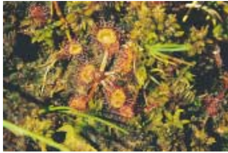
Rundblättriger Sonnentau (8)

Im Frühsommer sind jetzt große Flächen weiß von fruchtendem Wollgras. Sogar der »insektenfressende« Sonnentau keimt an nassen Stellen verstärkt auf offenen Trittsiegeln der Weidetiere.