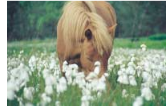
Islandpony im Wollgras (7)

Durch die Beweidung wird nicht zuletzt auch die kulturhistorische Nutzung wieder aufgenommen, die in mehreren Jahrhunderten zur Entstehung dieses wertvollen Lebensraums geführt hat.